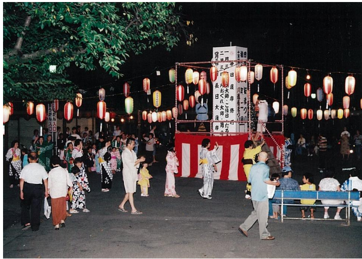
喜多院境内で行われた盆踊り