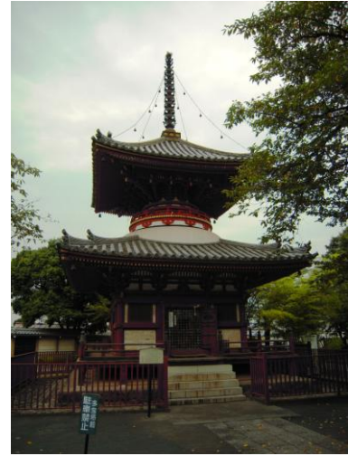
▲だるま市が行われる喜多院境内と多宝塔(写真右)

また、喜多院と地続きになっている東照宮、日枝神社は明治維新の神仏分離から喜多院と別管理となった。