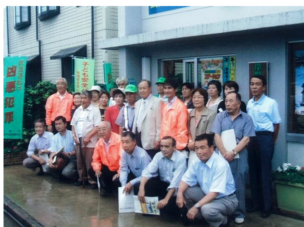
川口市自治会連合会視察