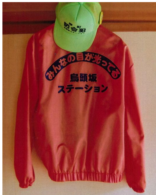
防犯ジャンパー、キャップ